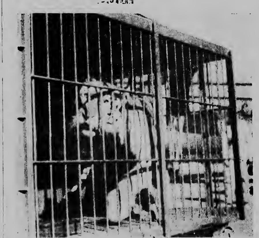
Mira con e tiger di Bengaal ta weita door di e trallan di su kanchi. E tin solamente un deseo: libertad!

di e terreno nobo di RCA pa nan keda aya por lo pronto te ora cu e cerca di e terreno bieuw di RCA, na unda e cierto lo establece, bini cla. Despues di e cabay, tambe a bini for di e mes acroplano hopi parti di e renti di e circo y por fin ademans algun tiger di Bengaal. Y cu esei e acroplano a keda bashi y a sali pa Maracaibo atrobe pa bai busca un otro cargamento. Segun nos a tende despues ayera tardi mas o menos pa cinco or a yega un acroplano cu mas material. Awe mainta ta spera segun noticia di ayera como diez acroplano mas di circo, entre cual como tres cu artistanan. Cuanto lo yega mayan ainda lo depende di e libereza cu nan traha awe. Tocante di e circo nos a tende tambe cu nan a haci presentacion na Caracas durante ocho siman y na Maracaibo tres siman. E circo tin 130 artista, entre cual Miss Celeste „e muher riba luna“ cual ta un di mas prominente di nan. Otro cooperador den nan ta e dominador di bestia hulandes, un cantidad di corredorjan di motor Aleman cu ta yama nan mes „los diablos del espacio“. Fu-Li-Chang kende ta cerca su espec tadonan conoci cu e misterionan di su patria y e „Dumbar Girls“ cu ta duna e numero di luchtballen. E intencion ta cu e circo lo duna su prome funcion Diasabra awor y despues di diezineo dia na Aruba, lo e sigui pa Corsow.